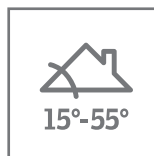
Pose verrière d'angle