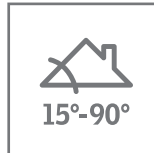
Pose sur rampant de toiture

Permet d'agrandir le couloir latéral dans le cas d'installation avec tuile canal si besoin.